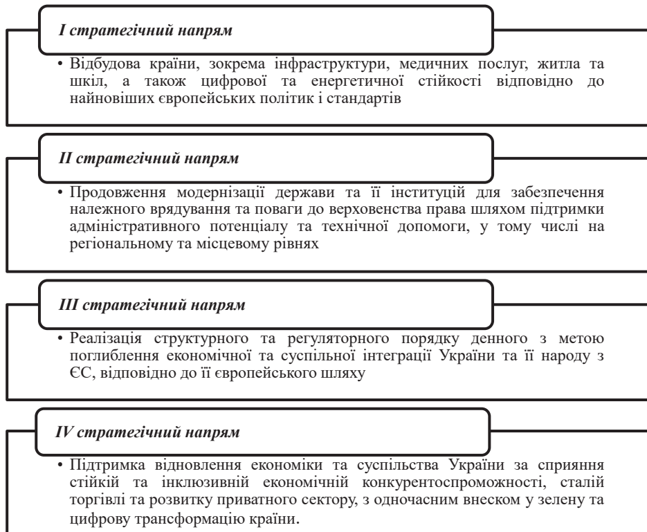
Рисунок 1. Стратегічні напрями допомоги та реконструкції України в рамках співпраці з ЄС