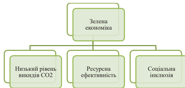
Рисунок 2. Ключові характеристики зеленої економіки у визначенні Програми ООН з навколишнього середовища

Зазначені політики й стандарти передбачають, що економіка має бути низьковуглецевою та енергоощадною, природоорієнтованою, мати ефективне та чисте виробництво, збалансоване споживання та базуватися на засадах спільної відповідальності, інноваційності, співпраці, солідарності, гнучкості та взаємозалежності, що дозволить посилити всі складові сталого розвитку аграрного сектору. В даному контексті слід зазначити про прийняття низки таких Законів України, як: «Про управління відходами» [8], «Про забезпечення хімічної безпеки